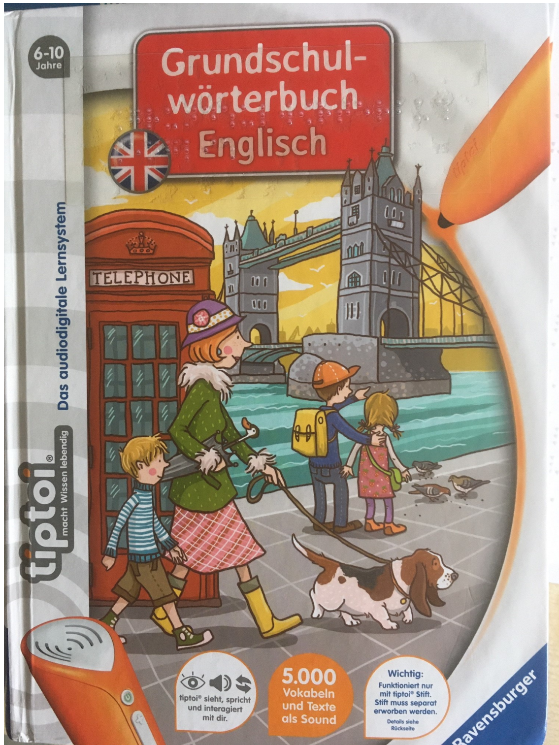
Foto: Cover des mit Brailleschrift beklebten Grundschulwörterbuches

Unsere Tochter ist blind. Ihr erstes Grundschulwörterbuch Englisch war aus dem Ravensburger-Verlag. Es handelte sich dabei um ein Wörterbuch mit dem Vorlesestift „Tiptoi®“. Der Ravensburger-Verlag stellt den Kindern mit diesem System ein audiodigitales Lernsystem zur Verfügung. Wörter, die man mit dem „Tiptoi® -Stift“ antippt, werden vorgelesen. Das Grundschulwörterbuch Englisch verfügt über etwa 5000 Vokabeln.